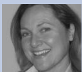
F. Press Dt.P.