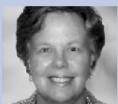
J. Harbour Dt.P.